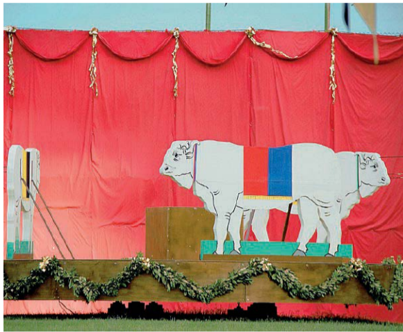
Tradizioni La Caccia al toro di Città della Pieve (sopra) e i balestrieri di Assisi (sotto)

In Umbria si va a spasso nel tempo. Gran finale domenica sera a Città della Pieve con il Palio dei Terzieri. Come ogni anno si è riaccesa l'antica rivalità fra le tre parti dell'allora Castel della Pieve, i terzi. Borgo Dentro, Casalino e Castello, fino a domenica giorno della gara al Campo de li Giochi, sono impegnati a dare vita ogni sera a rievocazioni storiche, mercati dell'epoca, spettacoli teatrali, caroselli d'armi, tamburi e bandiere, e giochi in piazza. Nello stesso periodo sono aperte le taverne, nelle quali deliziarsi con i piatti tradizionali. Tutto pronto dunque per domenica con la Caccia al toro. Valfabbrica fino al primo settembre ospita il Palio, giunto alla XLVII edizione. Gli eventi e gli spettacoli riempiono le serate, la taverna offre un servizio d'eccellenza ed i rionali lavorano mesi alla costruzione delle rievocazioni storiche. Tutto si svolge nell'attesa dell'ultimo giorno che, con la giostra cavalleresca, assegnerà ai colori del più valente dei Rioni il Palio.