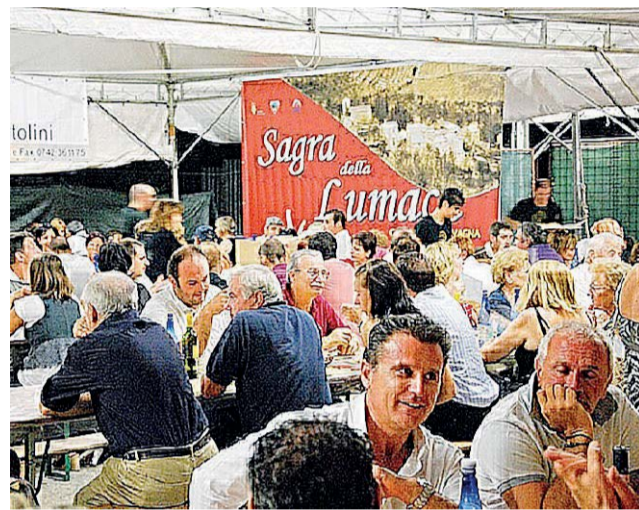
Festa A Cantalupo di Bevagna la sagra della lumaca. A Costano, invece, protagonista la porchetta. Fine settimana all'insegna della musica e dell'allegria in tutto il territorio regionale

A San Venanzo tutto pronto per l'Agosto culturale